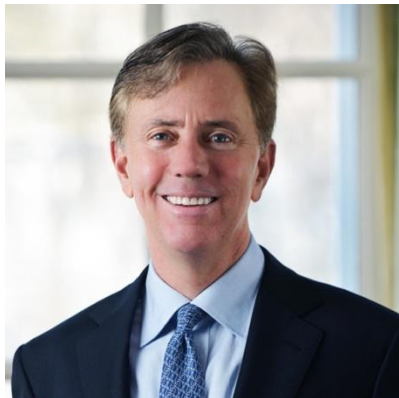
Ned Lamont (D)